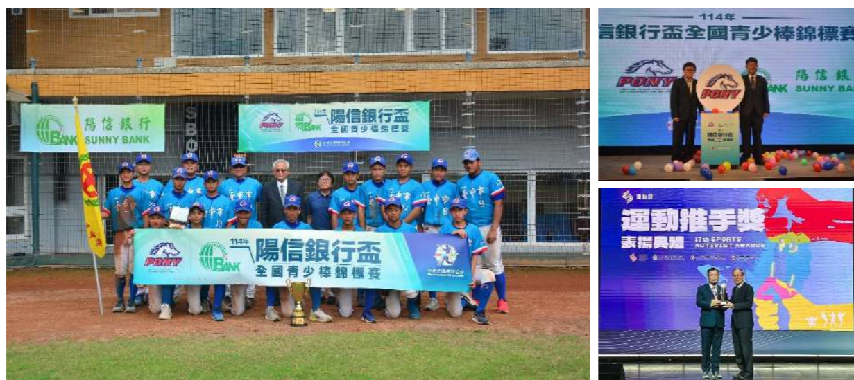
■ 上圖：114 年陽信銀行盃全國青少棒錦標賽於 114 年 5 月舉行，最終由台中市代表隊(中山國中)勇奪冠軍，睽違 17 年再度登頂，亞軍為新北市代表隊。 ■ 右圖：陽信銀行因長期支持國內基層與專業體育發展，贊助多項體育團隊及賽事，榮獲 114 年度(第 17 屆)運動部「運動推手獎」的「贊助類-銀質獎」。